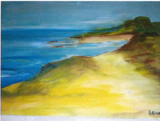
Olio su tela - 50x70