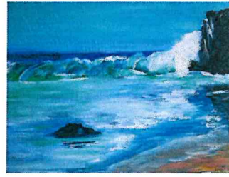
Pozzillo - Olio su tela - 50x70