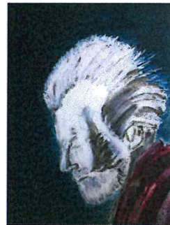
Riflessione - olio su cartoncino - 36x43