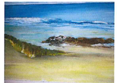
Olio su tela - 40x30

“Quando i miei pensieri sono cattivi, vado vicino al mare, e il mare li annega e li manda via con i suoi suoni grandi, larghi, li purifica con il suo rumore e impone un ritmo su tutto ciò che in me è disorientato e confuso”. R.M. Rilke