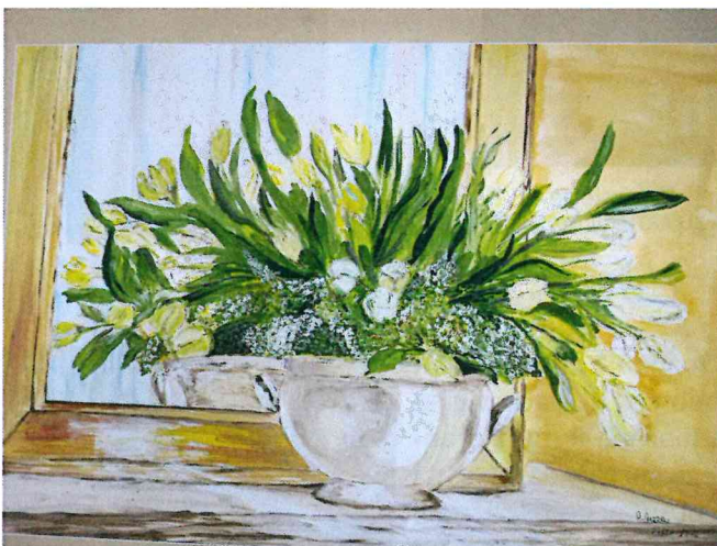
I tulipani- Olio su cartoncino - 100x70