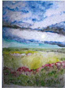
Acquarello Nuvole - 50x70