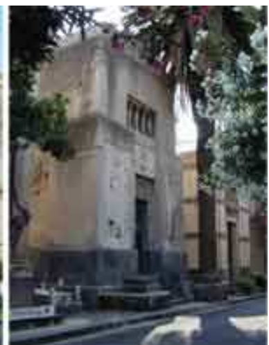
Cappelle funeraria dei primi anni del '900. Da sinistra verso destra Cappella Fortuna (1927, arch. Fr. Fichera), Cappella Patanè (1918, arch. Fr. Fichera), Cappella Fichera (1915)