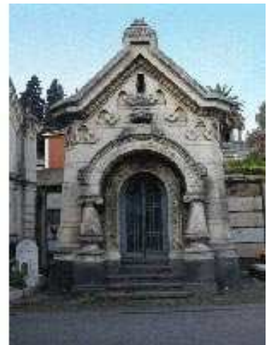
Le Cappelle funerarie realizzate dall'arch. Carlo Sada. Da Sinistra verso destra: Cappella Sisto Alessi (1884), Cappella Tomaselli (1905), Cappella Spampinato (1900)