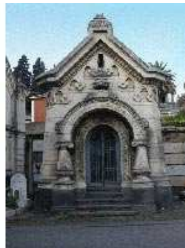
Le Cappelle funerarie realizzate dall'arch. Carlo Sada. Da Sinistra verso destra: Cappella Sisto Alessi (1884), Cappella Tomaselli (1905), Cappella Spampinato (1900)