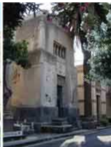
Cappelle funeraria dei primi anni del '900. Da sinistra verso destra Cappella Fortuna (1927, arch. Fr. Fichera), Cappella Patanè (1918, arch. Fr. Fichera), Cappella Fichera (1915)