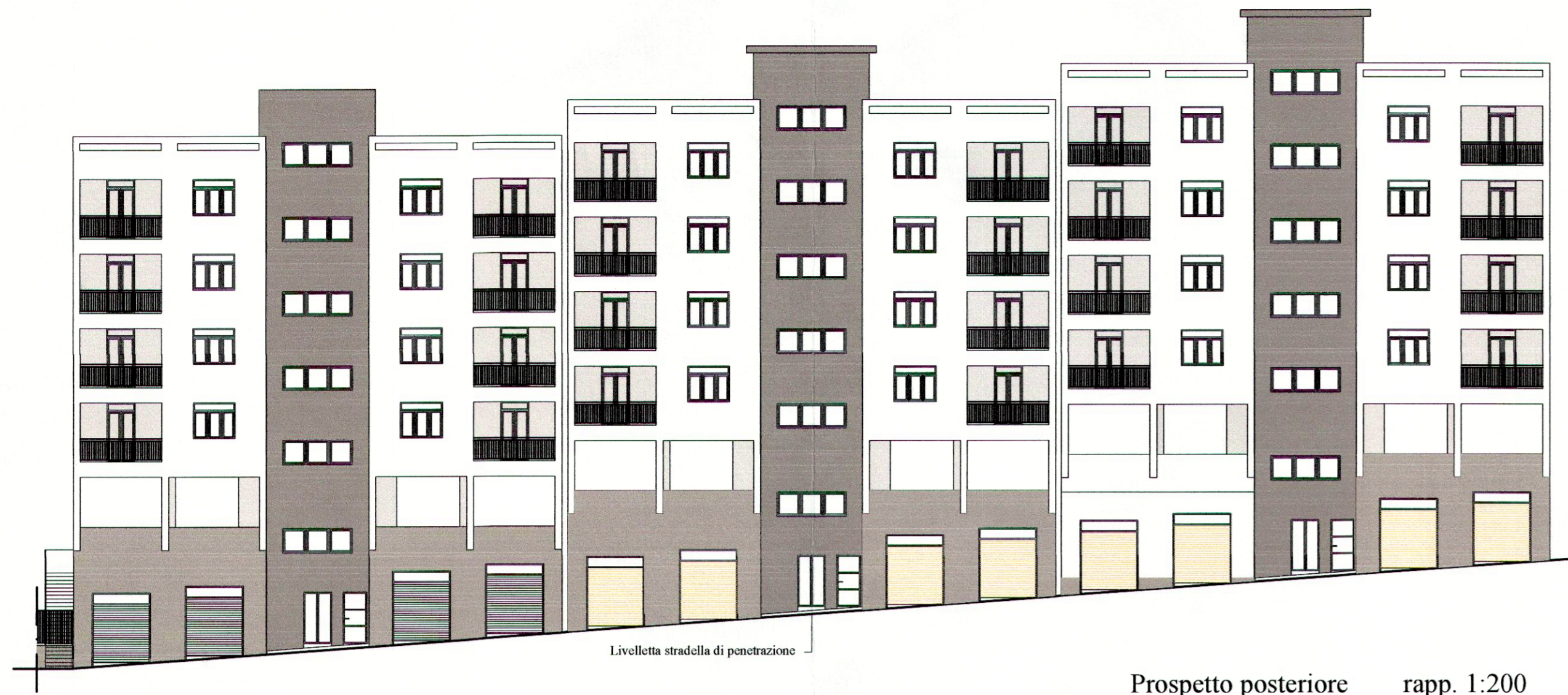
Prospetto posteriore rapp. 1:200