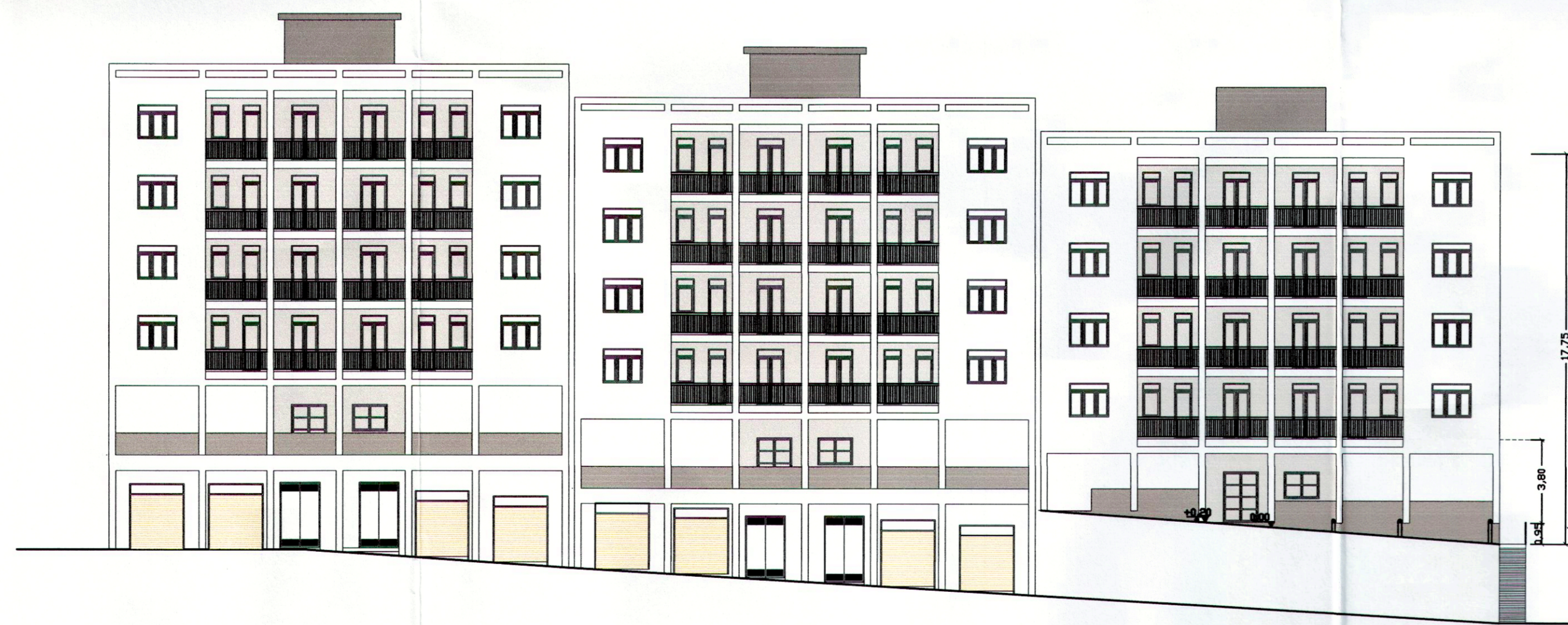
Prospetto principale rapp. 1:200